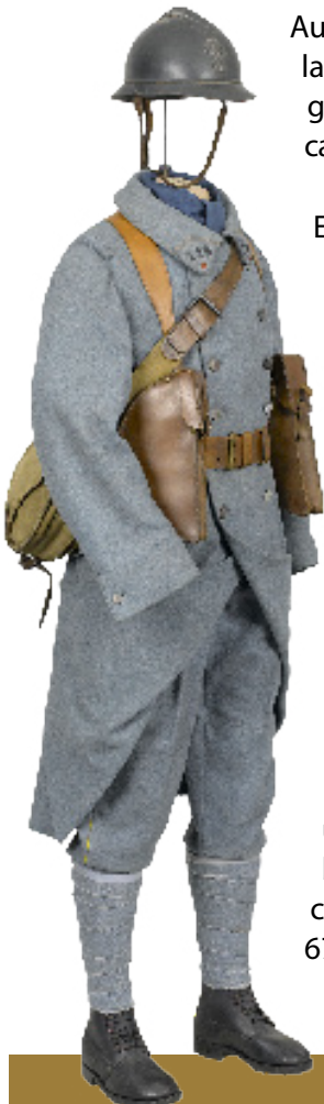
2 Fantassin du 119 e régiment d'infanterie. Inv. : Ga 618