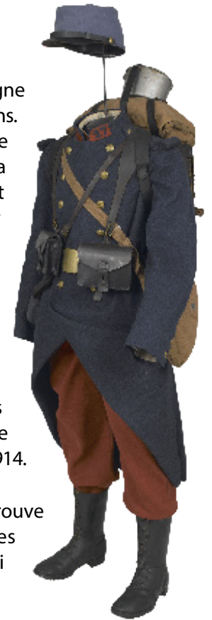
Fantassin du 27 e régiment d'infanterie. 1 Tenue de campagne. Inv. : Ga 451

Pour protéger la tête des soldats, l'État-major fait distribuer 700 000 cervelières entre février 1915 et fin 1915. Ces calottes métalliques, à placer sous le képi, constituent une protection aussi peu pratique qu'inopérante et finissent souvent en ustensiles de cantine. Le casque Adrian, métallique, commence à doter les unités à partir de septembre 1915 ; il est, dans les faits, perçu à partir de 1916 par l'ensemble des poilus. Il se compose d'une bombe métallique de 7/10 e de millimètre d'épaisseur sur laquelle sont rivetés un cimier, une visière et un couvre nuque, un insigne d'arme complète l'ensemble métallique ; l'intérieur est doublé en cuir de mouton, des bandes d'aluminium ondulé assurent à la fois son maintien sur la tête et l'aération. Le nouveau casque est peint en gris artillerie, la couleur du canon de 75 ; il existe en trois tailles et pèse entre 670 et 750 grammes.